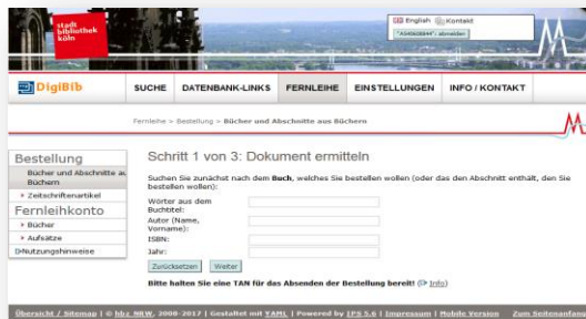
Screenshot: Fernleihe der Stadtbibliothek Köln

weitere Details zur Bestellung werden abgefragt; Eingabe der persönlichen Daten und der Fernleih-TAN .