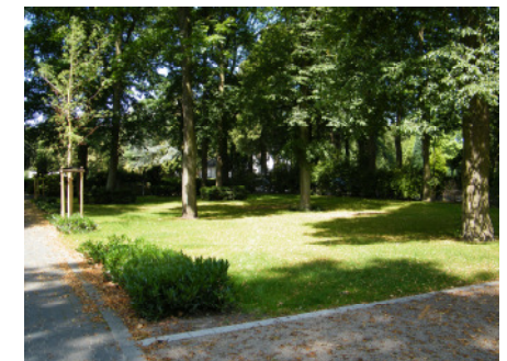
Urnengräber (westliche Fläche)