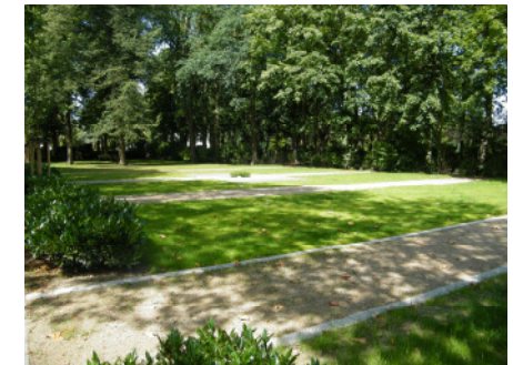
Sarggräber (östliche Fläche)