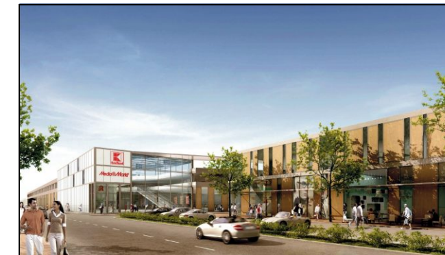
Südansicht Richtung Westen, neue Einmündung Cappelstraße