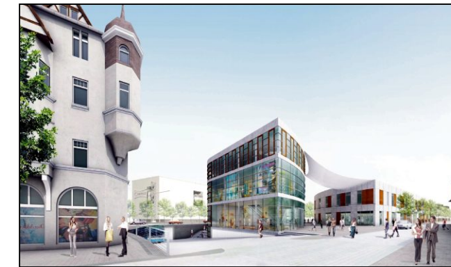
Blick nach Westen aus der Lange Straße Richtung Unterführung Südertor und Blumenstraße